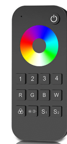
946012 Télécommande RGB 4 zones