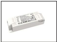
825007 Driver dimmable TRIAC 40W