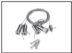
899098 Kit de suspension pour dalle LED x 4 (kit de 4 fils)