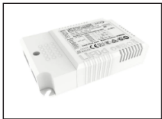
825004 Driver LIFUD dimmable DALI2 PUSH 40W