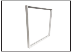
899047 Kit saillie pour dalle MONACO, LYON et TOKYO 60x60x6.5 cm