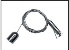
Filin de suspension