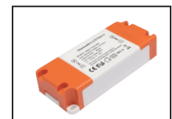
200002 Driver TRIAC dimmable 12-18W (produit en 12W)