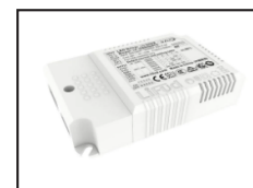
825002 Driver LIFUD dimmable DALI2 PUSH 20W (réglage 350mA)