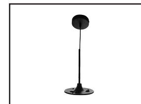
562010 Kit de suspension pour EVIAN noir