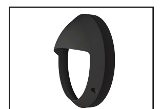
563014 Collerette asymétrique noire pour hublot VALENCE