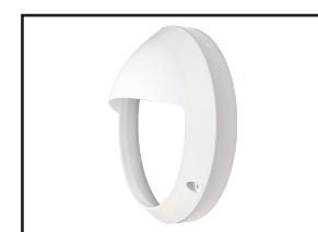
563013 Collerette asymétrique blanche pour hublot VALENCE