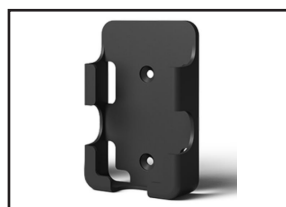
Support mural (visseries fournies)