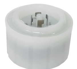
917015 Détecteur pour UFO COLMAR

*Accessoire indispensable pour le fonctionnement du détecteur